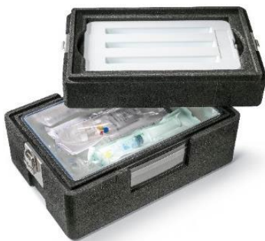
Abbildung 01: Onco-System, die neue Segmentlösung für Apotheken und Labore, ist auf den Transport von Zytostatika und anderen lebenswichtigen, temperaturempfindlichen Medikamenten in Infusionsbeuteln ausgelegt.

einen Blick identifizieren lassen (Abbildung 03). Die Kühlakkus für jeden Temperaturbereich sind gleich konfiguriert, was Apothekern und Medizinern die Anwendung und das Packen der Boxen erleichtert. Zudem bestehen die Systemlösungen aus nur wenigen, aufeinander abgestimmten Komponenten, die sich mehrmals wiederverwenden und bei Bedarf jederzeit einzeln nachbestellen lassen. Muss etwa die Box ausgetauscht werden, lassen sich Kühlakkus und Verschlüsse dennoch weiterhin verwenden. Onco-System und Clinic-System sind ab sofort und in jeweils zwei unterschiedlichen Größen erhältlich: Onco-System mit einem Nutzvolumen von 17 oder 30 Litern, bei Clinic-System haben die Kunden die Wahl zwischen einer Variante mit zwölf und einer mit 27 Liter Nutzvolumen.