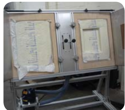
Allgemein: Mit der FOAMplus® Dual-Station können Kunden ein breites Spektrum von FOAMplus® Polstern für eine Vielzahl von unterschiedlichen Produkten sehr schnell herstellen.