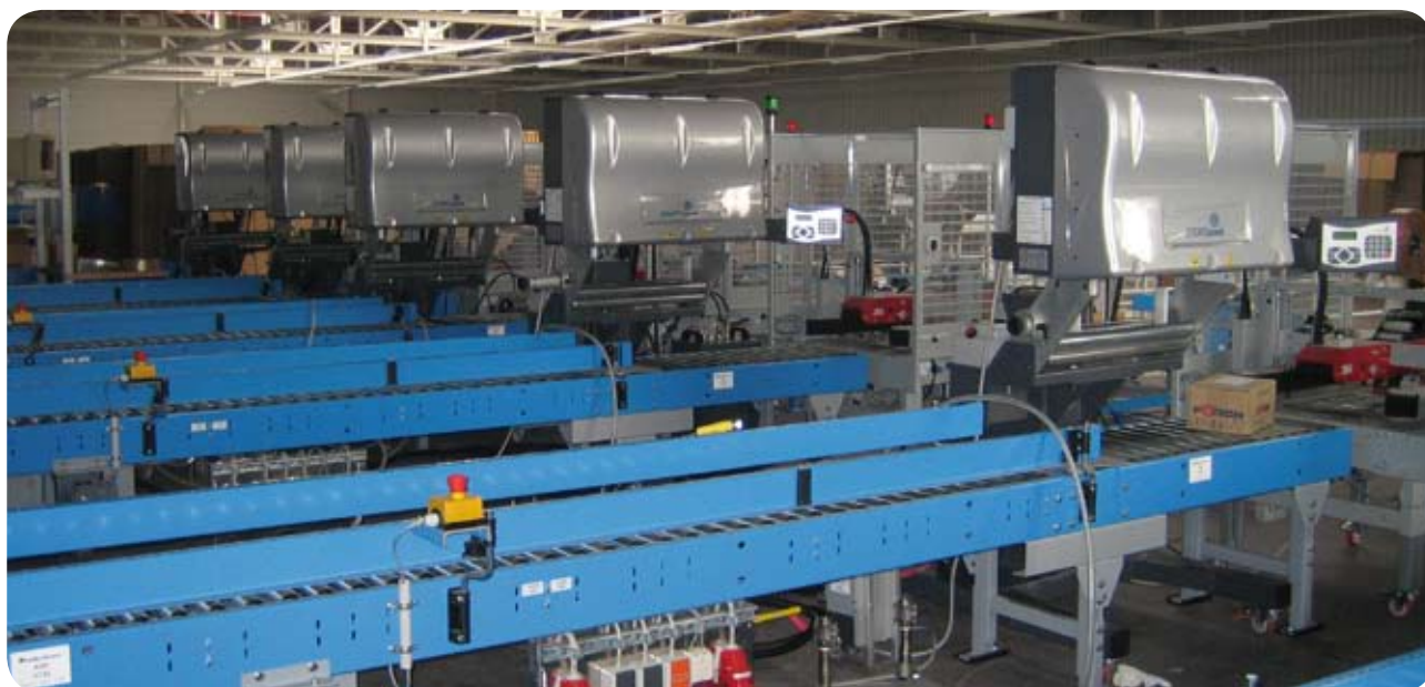
Mehrere FOAMplus® Bagpacker Maschinen in einer Integration direkt an der Fördertechnik oder am Packtisch.