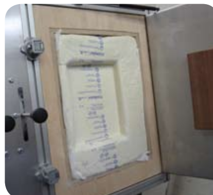
Schritt 4: Nach wenigen Sekunden ist das FOAMplus® Schaumpolster fertig.