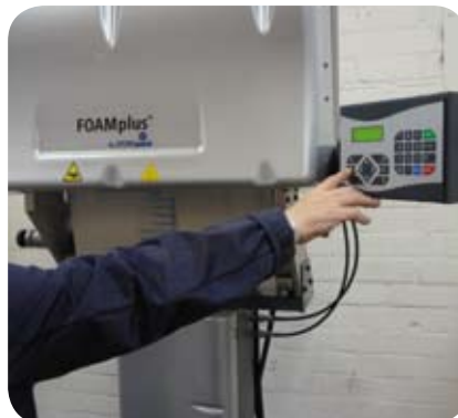
Schritt 1: Der Bediener wählt den programmierten Beutel aus.