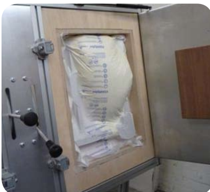
Schritt 3: Der Schaum expandiert in der Holzform.