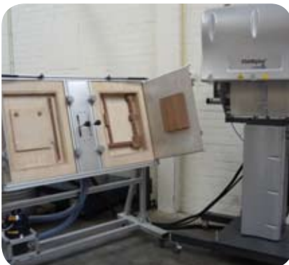
Der FOAMplus® Bagpacker in Kombination mit der Dual-Station.

Durch das Vorformsystem von Foamplus können ganz einfach individuelle Maßverpackungen in Serie angefertigt werden. Bei der Vorformung wird durch das programmierte Beutelmaß und Befüllung ein gleich bleibendes Polster gewährleistet, welches nur noch in die vorgefertigte Holzform eingelegt werden muss. So können bis zu 13 geformte Polster pro Minute produziert werden. Just in time gefertigte Maßverpackungen sparen kostbare Zeit und wertvollen Lagerplatz.