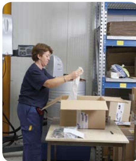
FOAMplus® Bagpacker Maschine in einer Einzelpackplatz-Lösung.