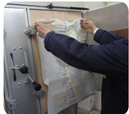
Schritt 2: Der Bediener platziert den besagten Beutel in der Holzform.