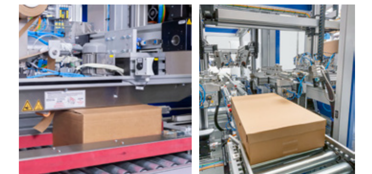
4. VERSCHLIESSEN MIT SELBST- ODER NASSKLEBE BAND ODER ALTERNATIV MIT DECKEL