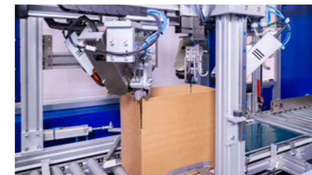
2. EINSCHNEIDEN DER ECKEN