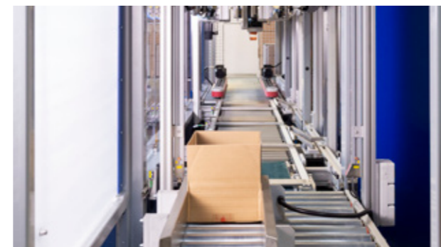
1. AUTOMATISCHE KARTONFORMATERKENNUNG UND ERMITTLUNG DER PRODUKTHÖHE IM KARTON