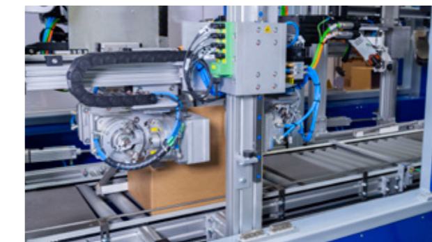
3. EINFALTEN DER DECKELKLAPPEN